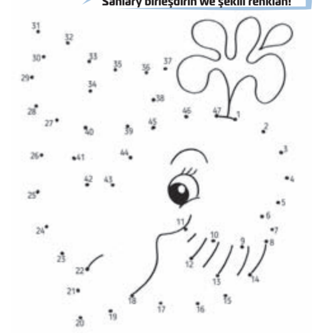
Saniary birleşdirin we şekilli reňkläň!