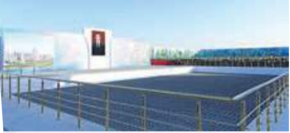
şyrmak göz öňünde tutulýar.

Hormatly Prezidentimiziň tagallasy bilen ýurdumyza ýokary hünär bilimi ulgamyň geriminiň barha giňeýän günlerinde paýtagtymyzyň görkünü artdyryjak 5 müň orunluk bu ýokary okuw mekdebinin binalar toplumuny 2026-njy ýylyň sentýabr aýynda ulanmaga dolý taýýar edip tab-