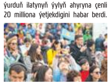
Gazagystan «ýaş» ýurt hasaplanýar. Raýatlaryň ortaça ýaşy 32 ýaşga deň

► 1-nji sentýabrda Gazagystanyň ilaty 19 million 944 müň 726-a deň boldy. Bu barada ýurduň Milli statistika býurosý habar berdi. Şaher ilaty 12,4 milliondan, oba ilaty 7,5 milliondan ybarat. Gazagystanyň paýtagty Astanada ilat 1,4 milliondan geçdi. Şu ýylyň başynda ýurduň ilaty 19,7 milliondy. Sentyabr aýynda Gazagystanyň Prezidenti Kasym-Žomart Tokaýew