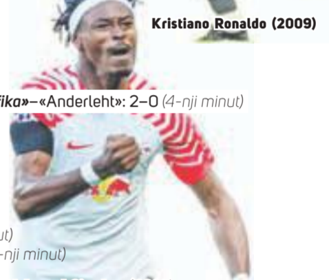
Kristiano Ronaldo (2009)