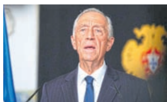
dogarda Ispaniýa bilen serhetleşýär, günortada we günbatarada Atlantik ummany bilen ýuwulýar. Portugaliýa dünýäniň ösen ýurtlarynyň biri bolup, 1910-njy ýyldan bäri unitar döwletdir. Yurt 1986-njy ýylyň 1-nji ýanwarýndan bäri Ýewropa Bileleşiginiň agzasy bolup, Şengen we ýewro sebitinde yerleşýär.

Ilkysy Pireney ýarym adasynyň günorta-günbatar böleginde yerleşýän kontinental Ýewropanyň iň günbatar döwletidir. Bu ýurt demirgazykda we gün-