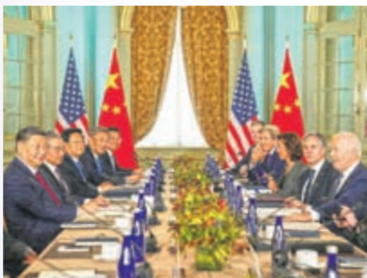
den «Klimatyň üýtgemegi we emeli aň ýaly ýüzbe-ýüz bolunýan global kynçylyklar tagallalarymyzy birleşdirmegi talap edýär» diýip belledi. Hytaýyň Başlygy Si Szinpin iki ýurduň ta-

11-nji noýabrda ABŞ-nyň San-Fransisko şäherinde Aziýa-Yuwaş umman ykdysady hyzmatdaşlygy (APEC) forumy öz işine başlady. Daşky gurşawa bagyşlanan hepdeligini dowamnynda dürli derejeli duşuşyklar geçirilýär.