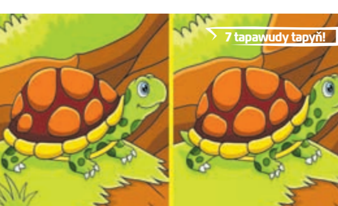
7 tapawudy tapyň!