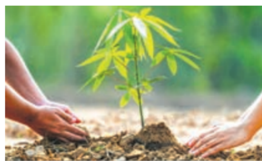
Mongoliýanyň Daşky gurşaw we syňahatçylyk ministrliginiň iň soňky maglumatlaryna görä, häzirkä wagtda ýurduň çäginde, takmynan, 77%-i çölleşmäge we yerleriň zaýalanmagyna sezewar bolýar.

Şunuň bilen baglylykda, mongol hökümetiniň 2020-2024-nji ýyllar üçin iş meýilnamasynda tokaýlary dikeltmek we olaryň meýdanyny 9%-e çenli giňeltmek ýaly birnäçe möhüm çäreler bar.