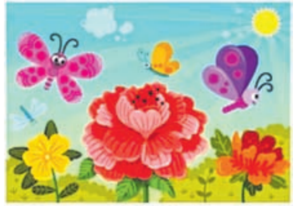
7 tapawudy tapyň!

Bahar paslynyň ilkinji günlerinde bir adam öz melleginiň bir künjüne bähül tohumlaryny sepip, oňa ideg edipdir. Günleriň bir günü onuň nazary şu gün erte açylmaly owadan bähül gunçalarynda eglendir. Yöne gülleriň baldagyndaky tikenlere pisindini oturma: «Yogsa-da nädip, ýiti tikenli ösümliklerden beýle owadan güller açylyp bilýärkä?» diýipdir-de, gunçalap başlan bähülere idi-yssywat etmesini bes edip, olary suwdan hem kesipdir. Netijede, gunçalap açylmaly bähüller kem-kemden süllerme bilen bolupdyr. Gynansak-da, käwagt durmuşda-da şuna meňzeş ýagdaýlar az bolmaýar. Her bir adama şol bähüller mysaly, ony üýtgeşik edip görkezýän tapawutly häsiýet aýratynlygy bolýar. Ol aýratynlyk biziň ganymyzda, eme-damarymyzda owal başdan ornaşyp, biziň her birimizde bar bolan «tikenleriň» - ýetmezçilikleriň arasynda boý alýarlar. Adatça, biziň köpi-miz özgelelere seredip, diňe şo «tikenlerdir» kemçilikleri görüp, öz aňmy-za görä, baha berýäris. Özgeleriň «tikenlerine» garaman, olardaky «bähülleri» görüp bilmek uklyby ynsanyň iň näýbaşy aýratynlygydyr. Ynsan köňüniň çuňlugynda kök uran mynasyp aýratynlyklary nazara alyp, kemçilikleri bolşy ýaly kabul etmek hem adamsa bolan söýgüniň bir nyşanydyr. Eger-de biz ynsanlardaky «bähülleri» özülerine görkezmegi başarsak, olar basym özüleriniň «tikenlerinden» dynmagyň ugruna çykarlar. Şondan soň olar hemişe «gül açyp pajarlanyl».