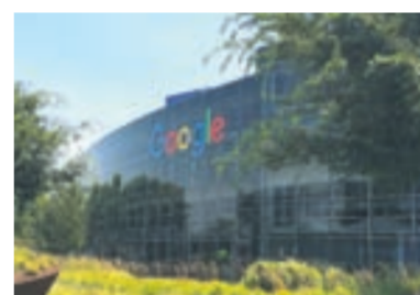
met çekýändigini, ýene-de 100 iş orunynyň dörediljekdigini belgenildi. Şeýle hem maglumat merkezinde emele gelen ýylylygyň jaýlaryň ýyladylmagynda peýdalanymagy üçin «Haminan Ener-

«Google» kompaniýasy Finlýandiýadaky maglumat merkezi-niň giňeldilmegi üçin 1 milliard ýewro maýa goýum öleşdirjekdigini habar berdi. Pul serişdesi Hamina şäherindäki toplumyň giňeldilmegi netijesinde iş orunlarynyň köpeldilmegi, innowasiýa we beýleki ugurlar üçin gönükdiriler. Bu barada ýaýradylan beýanatda «Google»-nyň 2009-njy ýyldan bäri Hamina maglumat merkezi üçin 3,5 milliard ýewro maýa goýum goýandygyny belgenildi. Häzirkî wagtda bu ýerde 400 adamyň zäh-