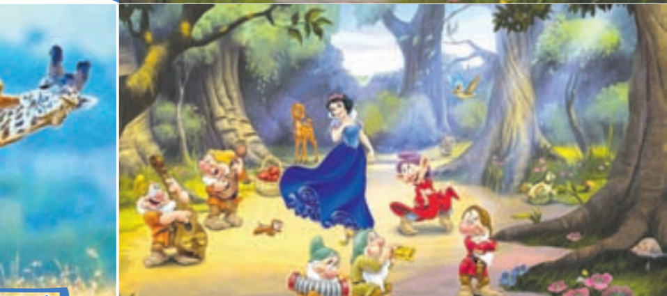
10 tapawudy tapyn!