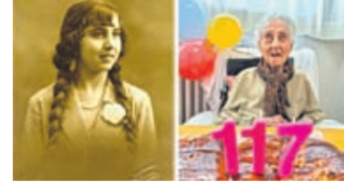
Moret bilen durmuş gurýar. Ýaş zenan 1976-njy ýylda çenil adamsynyň işleýän hassahanasynda şepagat uýasy bolup işleýär.

G örätmäge iň uzak ýaşayanlaryň ülkesiniň Ýaponiýadgy sebäpli, dünýäniň iň ýaşuly adamy hem ýaponlardan bolajak ýaly. Emma dünýäniň iň garry adamy Ýaponiýadan däl.