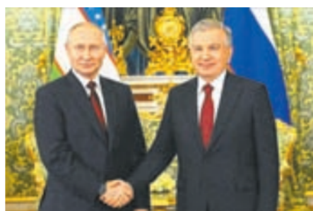
Prezident Mirziýoýew bolsa, Wladimir Putiniň taryhy sapary amala aşyrandygyny belläp, rus nebitiniň, nebit önümleriniň we tebigy gazynyň Özbegistana iberilişini artdyrmak boýunça ylalaşyklara gol çekilendigini aýtdy.

Russiýanyň Prezidenti Wladimir Putin döwlet sapary bilen Özbegistanda boldy. Wladimir Putin paýtagt Daşkentde Özbegistanyň Prezidenti Şawkat Mirziýoýew bilen duşuşygy, gepleşikleri geçirdi. Russiýanyň Prezidenti bu ýerde eden çykyşynda Özbegistana strategik hyzmatdaşlyk diýip baha berdi. Onuň sözlerine görä, iki ýurduň arasyndaky söwda dolanyşygy barha artyp, geçen ýyl 30 göterim köpeldi. Russiýanyň Özbegistana gönüden-göni maýa goýumalarynyň 10 milliard amerikan dollaryna ýetendigini mälüm eden Putin bu ýurtda 3 müň rus kompaniýasynyň iş alyp barýandygyny aýtdy.