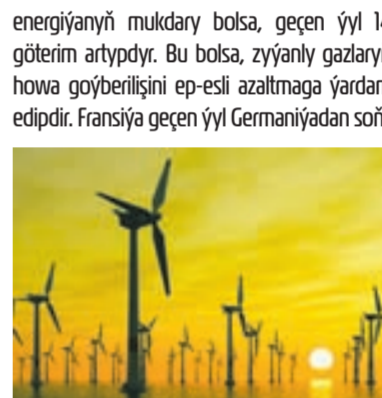
energiýanyň mukdary bolsa, geçen ýyl 14 göterim artdy. Bu bolsa, zyňanly gazlaryň howa goýberilişini ep-esli azaltmaga ýardam edipdir. Fransiýa geçen ýyl Germaniýadan soňra Ýewropa ýurtlarynda ýel energiýa önümçiliginde iň köp ösüş gazanan ýurt boldy. Ýurtda senagat önümçiliginde zyňanly gazlaryň howa goýberilişi 9 göterim azalypdyr. Gurluşyk, ulag we awiasiýa pudaklarynda hem öňyn netijeler alnypdyr. Ýurtda geçen ýyl demir ýol arkaly gidip bolýan gysga aralyklara uçar gatnawy ýatyrylypdy. Bu bolsa, awiasiýa pudagyna howa goýberilýän zyňanly gazlaryň 3,4 göterim azalmagyna getiripdir. 2018-2023-nji ýyllar aralygynda Fransiýanyň umumy emissiýasy 440 million tonna kömürturşy gazdan 370 million tonna düşüpdir. Bu bolsa, howa goýberilýän zyňanly gazlaryň 17 göterim azaldygyny aňladýar. Fransiýa Ýewropa Ýaşyl ylalaşygyna laýyklykda, 2030-njy ýyly çenli ýyladyşhana gazlarynyň howa goýberilişini 1990-njy ýyldaky derejeden 50 göterim azaltmaga maksat edinýär.

Geçen iki ýylyň dowamynda Fransiýada atmosferany gyzdyrýan ýyladyşhana gazlarynyň azaldygyny mälüm edildi. 2023-nji ýylda ýurtda howa goýberilen ýyladyşhana gazynyň möçberi 5,8 göterim azalypdyr. Ýurduň Daşky gurşaw ministrligi üçin howa bilen bagly maglumatlary taýýarlayan CITEPA guramasy şeýle ýagdaýyň dowam etmegi netijesinde ýurduň daşky gurşaw bilen bagly mak-satnamasyna ýetip biljekdigini mälüm etdi. Ýurtda geçen ýyl ýyladyşhana gazynyň azalýşy iň köp elektrik energiýasynyň önümçilik pudagyna hasaba alypdyr. Ýurtda sarp edilýän elektrik energiýasynyň 65 göterimi atom energiýa beketlerinden üpjün edilýär. Ýurtda ýel we gün beketlerinden alynan