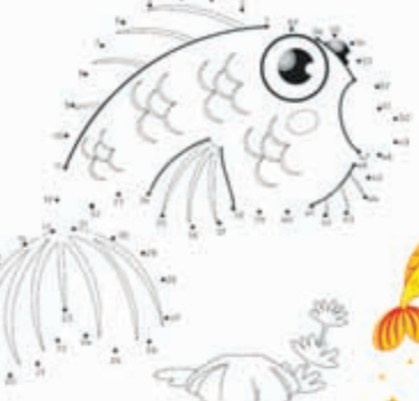
Sanlary birleşdirin we şekilli reňkläni!

GYSGAÇA TARYHY Jins berk matadan tikilýän balak bolup, 1873-nji ýylda Jeýkob Deýwis we Lewi Strauss tarapyndan oýlanyp tapylýar. Şol ýyllar jins sözi jübüleri mis bilen berçinlenen «gök balak» diýmegi aňladypdyr. 1950-nji ýyllarda berk matadan tikilen gök balaklar, esasan hem, ýetginjekleriň arasynda meşhur egin-eşik nyşanyna öwürülýär. 1960-njy ýyllarda dürli ýaşadaky adamlaryň arasynda ýaýrap başlaýar. Häzirkki wagtda her ýyl 10 milliard töweregi jins jalbar öndürülýär.