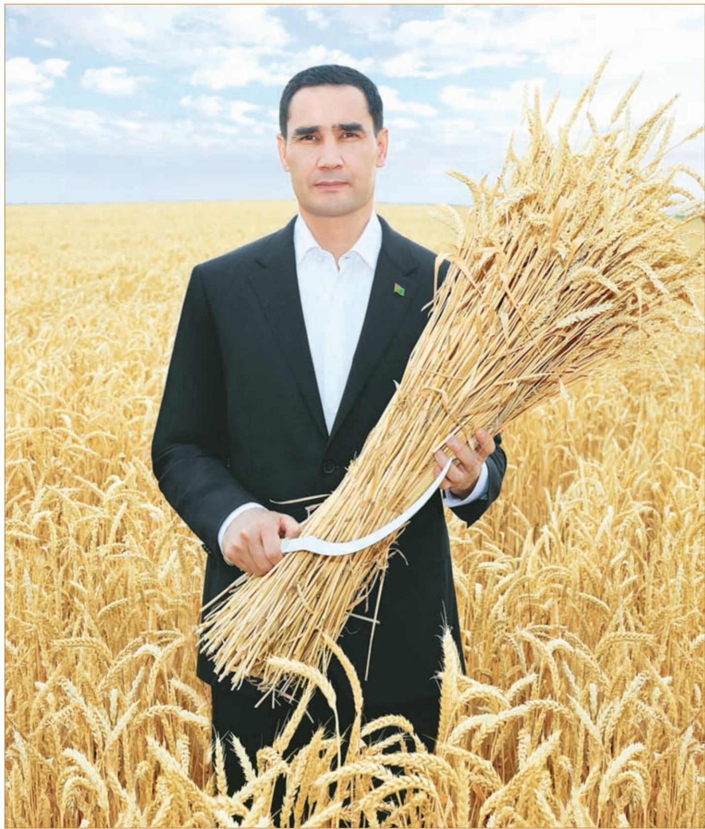
17-nji iýunda hormatly Prezidentimiz Serdar Berdimuhamedow Ahal welaýatyna iş saparyny amala aşyrdy hem-de welaýatda dowam edýän galla oragynyň barşy bilen tanyşdy.

Ir bilen hormatly Prezidentimiz Ahal welaýatynyň Ak bugdaý etrabynyň «Gäwers» daýhan birleşiginiň bugdaý meýdanyna geldi. Bu ýerde Arkadagly Gahryman Serdarymyzy ýurdumyzyň oba hojalyk toplumynyň deňişli ýolbaşçylary, Ahal welaýatynyň häkimi mahirli garşyladylar.